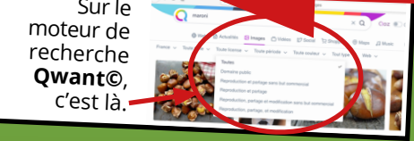
Sur le moteur de recherche Qwant®, c'est là.

Sur Google®, lorsque tu cherches une image, tu peux voir dans quelle mesure elle est utilisable ou non ! Exemple : Si tu tapes Maroni, voici ce qui se passe : tu cliques sur outils à droite puis sur "Droits d'usage"