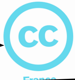
Clique sur la photo pour accéder au site

2 / LES CREATIVE COMMONS : MAIS QU'EST-CE QUE C'EST ? C'est une organisation internationale sans but financier qui permet aux auteurs de libérer leurs œuvres du droit de propriété intellectuelle grâce à 4 options et 6 types de licences, correspondant au type d'utilisation. POUR TOUT SAVOIR SUR LES CREATIVES COMMONS, C'EST LÀ ! Il y aussi les personnes qui renoncent à leurs droits d'auteur et donnent leur(s) image(s) au domaine public. Si elle présente ce logo, c'est bon !